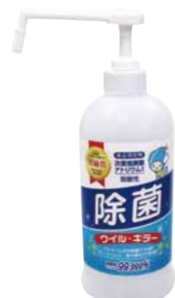
700ml ボトル 詰め替え用