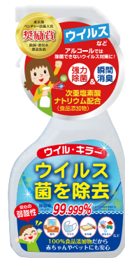
400ml スプレー レギュラータイプ